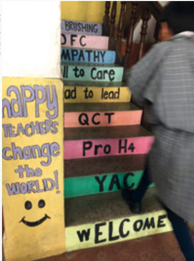
Escola em Thimpu